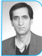
بررسی حوادث قسمت ۲۹