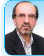
مکان بایی خطا در شبکه های توزیع

مدیرعامل شرکت همچنین افزایش بهره وری همکاران را یکی از مصادیق اصلاح الگوی مصرف نام برد و افزود: افزایش بهره وری آنچه در اختیار ماست اعم از نیروی انسانی، تجهیزات، ابزار و کالاهای تواند یکی از مصادیق اصلاح الگوی مصرف و صرفه جویی باشد. هنر مدیر ایجاد هماهنگی بین نیروها برای افزایش بهره وری آنها می باشد. وی یاد آور شد: اگر قبول داریم مهمترین سرمایه ما نیروی انسانی