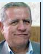
ابرج عراقی درگز